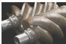
Not using Ultra FG