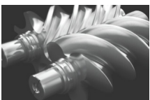
Using Ultra FG