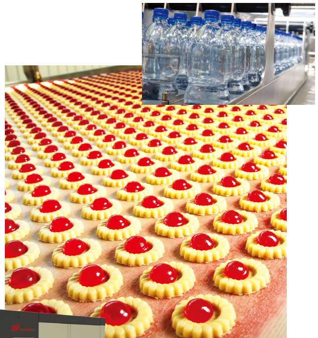
Ultra FG 는 압축기를 음식물 오염 및 연마제 침전물로부터 보호하여 압축기 시스템의 신뢰성과 생산성을 높여줍니다.